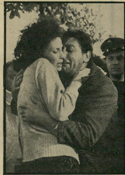
סוף המישחק: הזוג המוכם כל זכייה היא אשליה

יש ברט הזה כל מה שמאפיינ את קומנצ'יני ברט, והרבה מן הקומדיה הי עממית האיטלקית בכלל. אהבת-אנוש, התחושה של שותפות בגורל מעורבת בי אינדיווידואלים קיצוני, הומור שגובל ל- עיתים בבורסקה (בעיקר בהעוויותיו של אלברטו סורדי), המעורב בפאתוס ובמרי רות (במיוחד בהופעתה המרשימה של סילבנה מאנגאנו), ונכונות לראות את הי צדדים החיוביים אפילו בנבלים הגדולים ביותר. צריך להוסיף לכך את אהבתו הי גדולה של קומנצ'יני לילדים, שלהם הי דיש כמה סרטים וסביבם עשה סידרת טל- ויזיה תעודית מרתקת בשם הילדים ואנח נו, ואת נכונותו להראות את הנשים כדמויות דומיננטיות חזקות. בט דייוויס וסילבנה מאנגאנו מכתבות את אופי הי סרט הזה, לאור כל אלה אפשר לראות