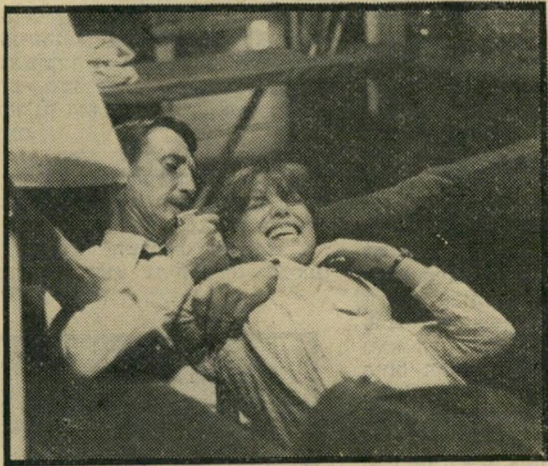
שיידר ומארגולין: ד"ש מהיצ'קוק

קשה לומר שזה הסיפור המקורי או המשכנע ביותר בעולם. דברים שקורים בתחילת הסרט אינם מוס-ברים בסופו, והדמויות שטוחות ושיגרתיות. שלא כמו אצל היצ'קוק, אין כאן הרבה אמונה בדמיון הצופה, והסרט דוחף מדי פעם בפעם את העלילה בכך גדולה, כשהוא מגלה כמה קלפים בטרס-עת, ולא בצורה מתוחכמת ביותר. אבל לצופה אין פנאי לקטנות שכאלה, כאשר הבימוי הנמרץ של ג'ונתן דם מציג סימני שאלה לצד חוט העלילה המרכזי, ודואג שתעלומה חדשה תצוץ עוד לפני שנפתרת קודמתה. בקצב כזה, כשהמצלמה נעה ללא הרף וכל מה