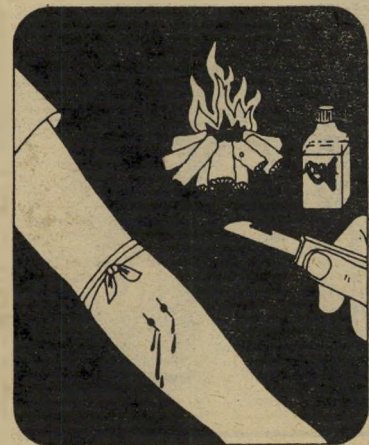
טיפול בהכשת נחש אמא, כואב לי

שני ספרים שימושיים ראו אור בתירגום לעברית, ומן הראוי כי אחד מהם יהיה בכל בית. הספרים הם איך ומה בעת צרה* ואמא כואב לי** שני הספרים הינם מדריכים לטיפול של עזרה ראשונה ומחלות בבית. איך ומה בעת צרה עשוי במתכונת אלבומו, שימושית עד מאד, והוא מקיף הוראות פשוטות, מהירות ומאוררות לכל