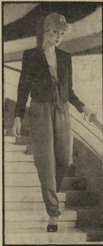
מקטורן שחור מעד חליפת-ערב בד משי דק

מדורי האופנה בעיתונות מלווים בדרך כלל בתמונות ובאיורים, כדי שאפשר יהיה לראות כיצד מורכבת מערכת-הלבוש. חלק מן הציורים האלה נעשים כלאחר יד, אך לעומתם יש כאלה שאפשר למסגר ולחלות לקישוט החדר. ציורי-האופנה של ריקי בן-ארי הם דוגמה לאסתטיקה ולטעם מעודן. זה שנים שציוריה מעטרים ומלווים כתבות-אופנה, ונראה כי ציוריה ניהנו בי חוש נבואי. אפשר למצוא בהם את הי אופנה לעתיד. אולם, ציורים לחוד ומצייר אות לחוד. לא אחת גילתה ריקי שהמרחק בין ציוריה לבין המציאות ברחוב האופנתי הישראלי הוא רב. כמה שנים יכול משהו להתעצבן? יום בהיר אחד מתחה את הגבול. למה להתרגז לעיתים כליכך קרוי בות? החליטה ועשתה. ציירה ציורים רבים, הניחה אותם מולה והתחילה לגזור. ואחרי שגורה, התחילה לתפור. והתוצאה?