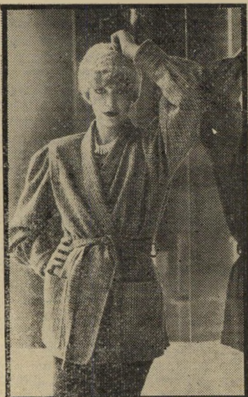
מעיד קצר לעונת החורף מצמר אנגורה

זו הפעם הראשונה שיש דמיון מדויק בין המצוייד למוצר. בתצוגת-האופנה שבה השתתפתי השבוע הציגה ריקי בן-ארי את דגמיה לעונת הר חורף. הבדים מתוצרת-חוף, צמר, אנגורה ימורה. כולם רכים ונעימים. הדגמים כול-לים חליפות ספורטיביות, חליפות אלגנטיות, מעילים, מעילי שלושת-רבעי, מעילים ארוי כים גטולי שרוולים. לערב מציעה ריקי בן-ארי שמלות וחליפות מיכנסיים, סרבל אל-גנטי כשמעליו ז'קט קטן. הבדים לשימוש לחליפות-הערב הם ממש, מסריג דק ו-מסאטן. ואם מותר להוסיף הערה אישית, נהנית בתצוגה הזאת מן הדגמים הרבים היפים.