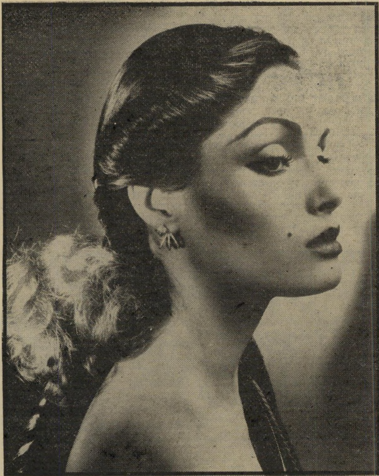
צבעים ורודים בוהקים וזחוכים עם שיוף מכעי מראה חברת-הקוסמטיקה „איייר“