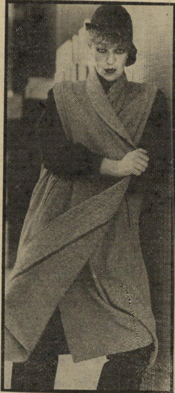
מעיד ארוך ללא שרוולים מצמר מזהר

בצד דיגמי האופנה לחורף, מציפות אור-תנו חברות התמרוקים בשלל הצעות ל-איפור ולטיפוח-התן. כל חברה מציעה את המראה החדש. ומי מאיתנו אינה רוצה ל-הראות כמו חדשה. חברת אייר מציעה לנו את מראה הטובאגו. כיאה לאיי טובאגו שטופי-השמש באיים הקריביים. גם המראה החדש הזה מוכיר את צבעי השמש. ושמים זאת על העיניים, על הלחיים, וכמובן על השפתיים. במראה הנה את זוהרת ובוהקת כשמש בצבעים: ורוד בוהק וזהוב. זכרי שהמדובר באיפור לעונת-החורף, כשה-שמש היא מיצרך מבוקש והגעגועים ל-קרניים החמות והזהרות הם ממש כגעגועי האוהב לאהובתו. לכן המייקאפ הפעם הוא בצבע שווף טבעי. מי מאיתנו לא תרצה להיראות כשמש העולה מן המזרח ביום של תורף?