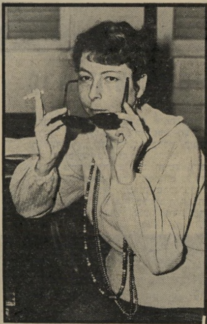
מתעוררת הררי בכל מקום הדלתות סגורות

עם מקל ועם כלי, דבורה, שאך שעות ספורות קודם לכן דיברה עם אחיה, מדריך הצניחה, הייתה המומה. היא נסעה הביתה, גילתה שהוריה לקו בהלם וחלו. כאשר התחילה לאבד את כושר הראייה שלה, לפני כארבע שנים, אמר לה אחד המומחים בעלי השם, כי יתכן שמחלתה