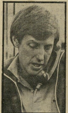
בלש פרטי: דאגן שבת, שעה 10.15

● קווינסי (11.10). חגיגה ביום שישי. במקום הוואי-חמש אפס חוזר למסך הקטן הרופא הפאנתולוג קווינסי. הוא נגרר, כאילו בעל כורחו, לעסי-קי בלשות ההופכים לחלק בל-תינפרד מעבודתו הרפואית. כל גילוי של קווינסי הופך תיק פשוט לפרשה מישטרית מסר-בכת. הדירתו של קווינסי לע-בודה המישטרית גוררת אותו לעימותים עם מפקד המישיט-רה. את קווינסי מגלם ג'ק קלוגמן, שהופיע על מסך הטל-וויזיה בזוג המוזר ובסידרה הסניגורית. בזוג המוזר שיחק קלוגמן את כתב הספור המפור-זר. עפיתו לסידרת קווינסי.