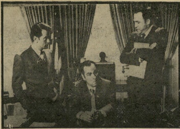
שאיפה לרא מיצרים: פרמון, טורן ושיין יום שישי, שעה 10.20

שהיה בטיס-שכר. איש לא נותר בחיים. 176 איש נספו-לו ריצ'ארד ווטסון היה עניין מיוחד בהתנגשות. חברתו, רות פורטון, הייתה הדיילת של ה-מטוס הבריטי. ווטסון סס ל-יוגוסלוויה כבאי-ח מישפחת