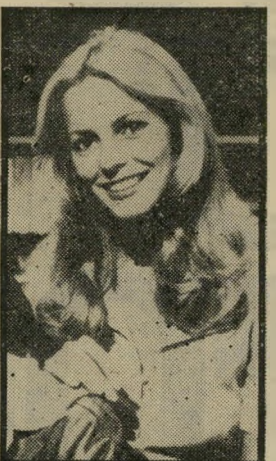
החבובות: לאד יום ראשון, שעה 8.30

● סיפורי אהבה נוסח אמריקה (11.25). בכל פעם שאין לטלוויזיה מה לשרד היא מעלה על המסך שידורי-חוזר, ואם אין שידורי-חוזר מתאים, היא מקרינה קטעים מסידרה זו, שקטעי הפתיחה שלה מצוי-יניים.