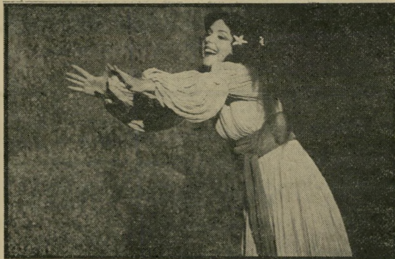
קאתרינה עז בימת האופרה ב"נשף המסיכות" של וררי „אחת נראית לעין והשנייה ניסתרת“

אים לו. „שתי פנים ללבנה, אחת נראית לעין השנייה ניסתרת. כך גם לגיבורת הסרט, קאתרינה: זמרת אופרה ואם לנער בן 15. „הסכר הוא של ברטולוצ'י עצמו. התינוק והאם. משום כך, לא התפלא איש כאשר בסצנת הפתיחה נראית כוכבת הסרט, ג'יל קלייבורג, רוכבת על אופניים בדרך כפרית באיטליה. על מושב קטן, מתחת לכידון, תינוק שפניו מופנים כלפי אמו. השעה שעת לילה מוקדמת. השמיים כחולים כהים, השדות אפופים חושך וער"פל. האשה רוכבת ומחייכת אל התינוק, הוא מתבונן אליה ואל הלבנה הנשקפת, חיוורת, מאחוריה, על הרקיע. בהדרגה, מתמזגות פני האשה ופני הלבנה לדמות אחת בעיני התינוק.