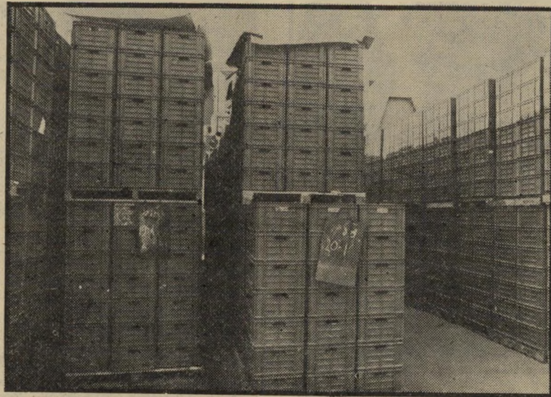
מוזאי שד חלב מעוקר ב„טנאי-נונה“ בקריית-מלאכי 30 אלף בקבוקים ליום