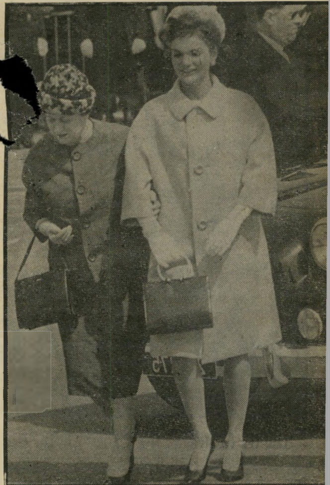
1961 — אשת-נשיא דה-גול עם אשת-נשיא קנדי, בפאריס