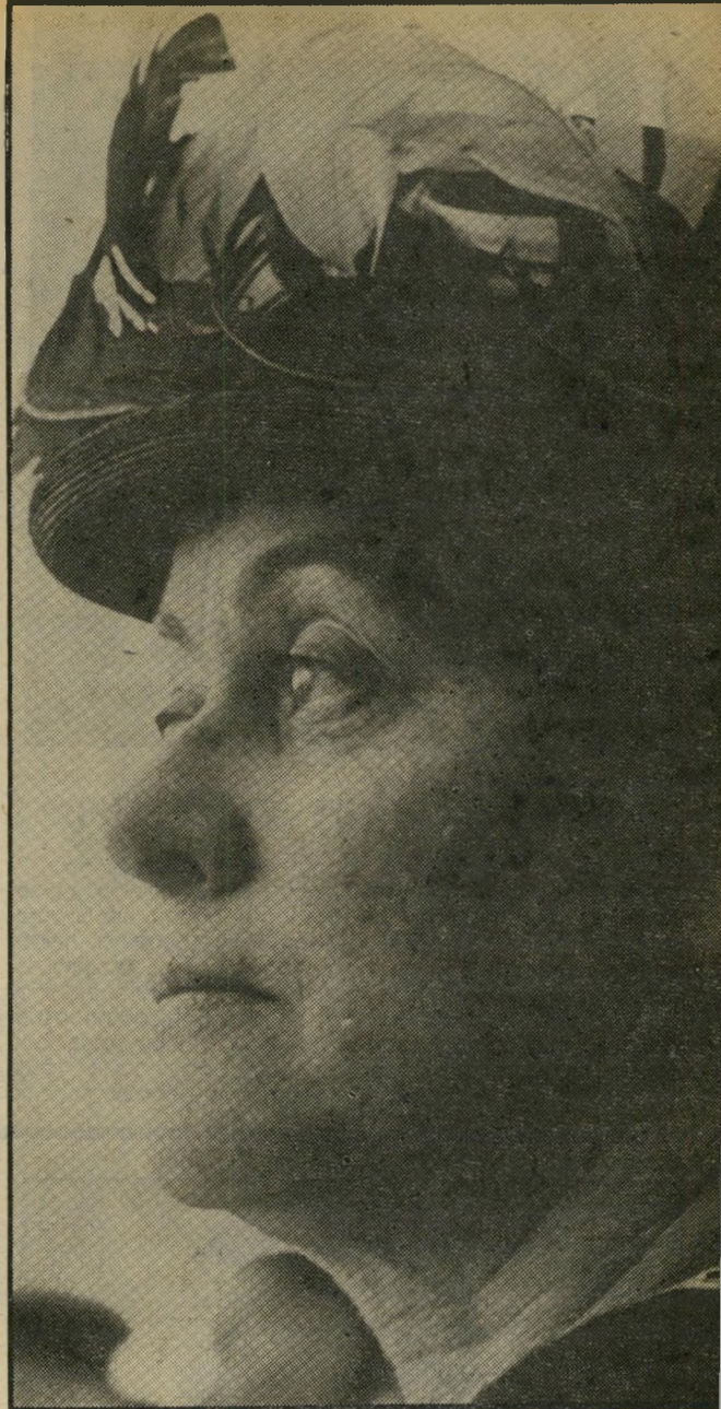
הכובע האופייני : איבון דה-גול בשעת קבלת פנים רשמית