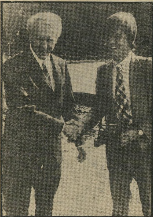
גיוען פמית ובנו כמו בדרום לבנות

קולו של נשיא זאמביה, קאנאט קאונדה, רעד מהתרגשות ומוזעם. מבטאו האפריקאי הכבד טישטש קצת את ניסוחיו הצ'רצ'יליים. המסר היה פשוט וקצר. קאונדה הכריז על מצב חירום ועל גיוס מלא. התוקפנות הרודית כלפי ארצו הגיעה לשיא חדש. הבישוף השחור, אבל מוזארווה, והרמטכ"ל הלבן והנוקשה שלו, גנראל פיטר ואלס, עושים כמיטב יכולתם להרוס את זאמביה מבחינה כלכלית. ההסדר הכפוי על רודזיה, שיום שריהוץ הבריטי, לורד קארינגטון, מגביר עוד יותר את תוקפנותם. חילוקי-הדעות בין הגיוענים הלבנים למשתפי-הפעולה השחורים בממשלת רודזיה מסככים ומערפלים את המצב. הסכוך בלאו הכי, אבל התהליך ההיסטורי נמשך. הבסיס לשילטונו הצבאי והכלכלי של המיעוט הלבן