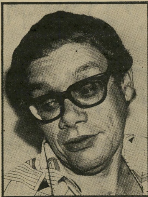
תיו מהעבודה-מפ"ם ויאפשר למנחם בגין (שוב) להרכיב ממשלה חדשה בקדנציה הבאה.

אם ילך עם של"י, אומר לנו הסופר יהושוע בעשרות מאמרים, הרצאות, ראיונות בעיתונים ומגישות היו"ר (פרס) עם אנשי תרבות ואמנות (המנחה: בקי פריש-טאט), יתמוך בגוף קטן ובלתי חשוב, שיקח את קולו-