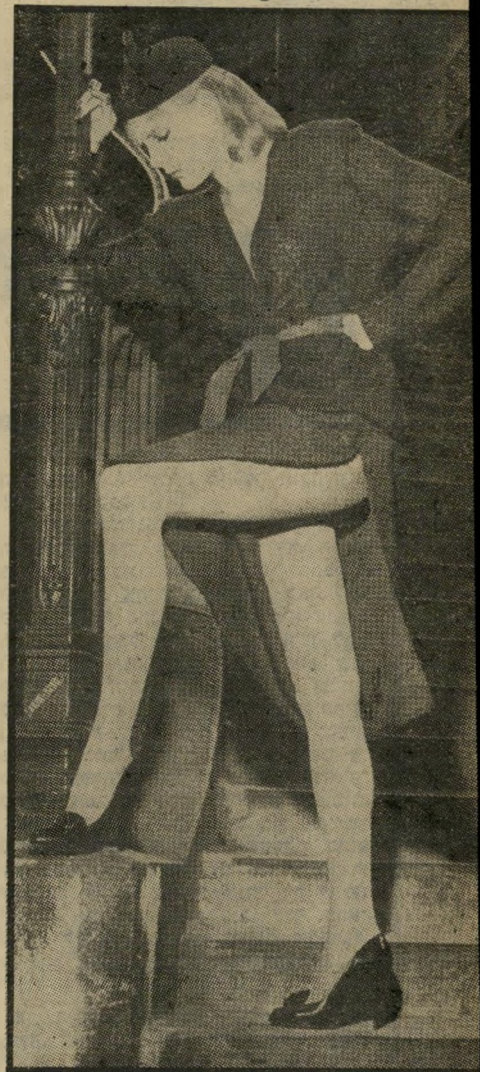
השסע הולך ומעמיק בחצאית מבית האופנה האיטלקי, אלברטה פראטי

שסע הולך ומעמיק. ומי יודע לאן נגיע. כפי שאתם רואים, נוח מאד לעלות במדרגות עם חצאית כזו. שלא לדבר על מחול סוער על פני רחבת-הריקודים.