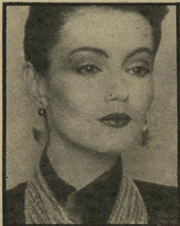
גווני חומים זהובים כמו הקוניאק

בואו נעיף מבט, מה התחדש בתחום אופנת האיפור לקראת התקופה הקרירה של סתיו-חורף 1979-80. הלנה רובינשטיין מציעה שלל צבעים עזים ולוהטים, בגווני הקוניאק והיין. את שואלת מה זה קוניאק כשמדובר באיפור. ובכן, זוהי אופ-