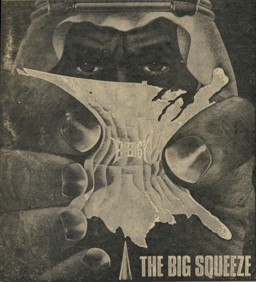
THE BIG SQUEEZE