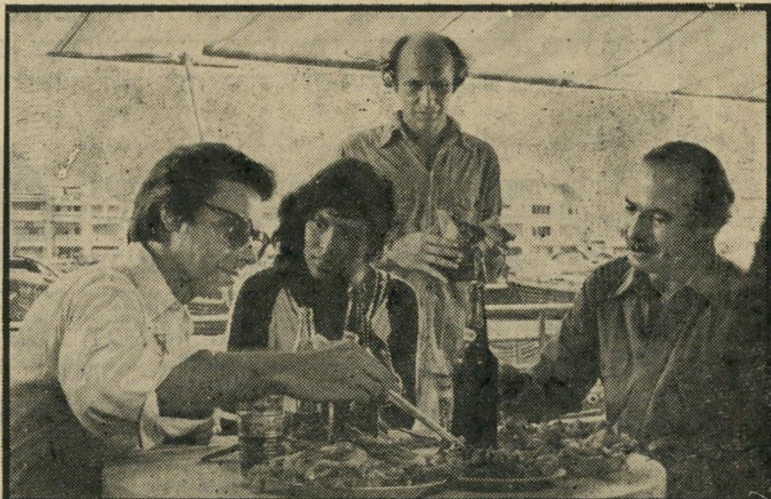
שחקן גאזארה, ידידתו ההודית ושחקן-במאי בוגדאנוביץ' ניחוחות שוקים ואוויר דחוס