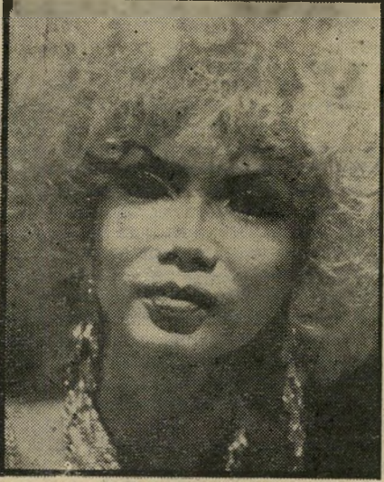
פני יצאנית ב"מלאך ג'ק" סחורה הוגנת

כדאי, אולי, להזהיר את הצופים, בטרם תגיע הגברת אקרמן עם סר"טיה לארץ. המדובר הוא בסרטים שבהם המצלמה כימעט שאינה זזה, סרטים שיש בהם שת"קות ארוכות ("הדיאלוגים מעניי"נים יותר כמוסיקת-רקע של דיקלום". היא אומרת) הדורשים מן הצופים סבלנות ור"י כוז רב, 23 כמו ז'אן דילמן, רחוב ה"מיסחר מ"ס 18, הנמשך קרוב לארבע שעות, עוקב כימעט ללא מילה אחרי ה"חיים האפורים, חסרי הגיוון וחסרי התיך"