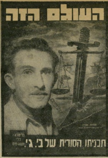
העולם הזה 892 תאריך: 18.11.54

סגן-אלוף שימעון אכירון, על "סקודה פוליטית שמנעה השמדת הנייטות המצריות!" כראיון מסביר אכירון מדוע איברה או ישראל את פירות ניצחונה בחזית הדרום. בשער הנילון: סגן-אלוף שימעון אכירון, מעשה ידיו של צייר המערכת שמואל בק.