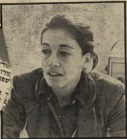
מזכירה כולם חשמל, מים וביוב