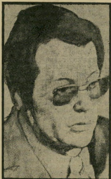
מתאבד ג'ונס 21.11.1978

21.11 — ג'ים ג'ונס, מנהיג כת מקדש העם, התאבד יחד עם 900 מחסידיו ב-גיאנה.