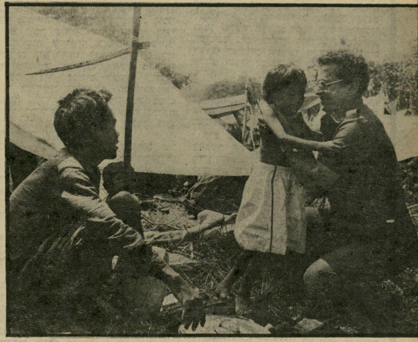
אייבי נתן כנבול קמבודיה כחשיר רנטגן במימון "קול השלום"

כ שנזקקו לו, הועיקו אותו. זה היה במופע האמנים שערכו אנשי הטלוויזיה הישראלית ביום הראשון בשיבוע שעבר, בהיכל התרבות בתל-אביב, במיסגרת מיבצע ההתרמה למען פליטי קמבודיה. במופע המאראטוני שהתמשך אל תוך הלילה הסתמנה נקודת משבר. בשלב מסוים התעייף קהל הצופים וה-