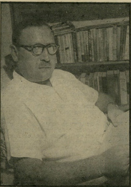
חבר מרכז לח"י ילין-מור בתל-ליטווינסקי *

ביום ההתנקשות הייתי בתל-אביב, אצל חבר שלנו,