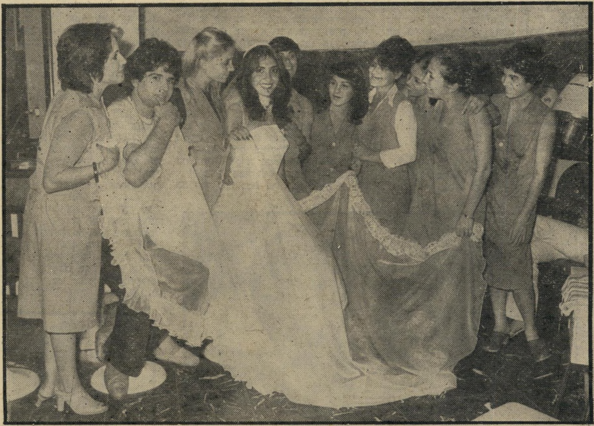
ב„אולמי אמבר“ מקפידים לבחור לכל תפקיד את איש המיקצוע הטוב ביותר בתחומו. כך הורכב צוות מעולה לטיפול בכלה ובחתן. זהו הצוות שדאג לי במשך כל היום כאילו הייתי בת יחידה. האווירה הנעימה שיוצר הצוות, משחררת ממתחים.

באו לקחת אותנו. ברחוב הסתכלו רק עלינו. לא היו לנו בלוים על האוטו, אבל בכל זאת — היו מסמר דיוגנוף. הם צודקים, חתיכים כאלה רואים כל יום, כל מי שיוצא מאמבר נראה ככה. אני חושבת שחיכו לנו ברחוב. כל החתונה היינו בחלום. גם האור- חים שלנו אמרו שכוה אולם יש רק בסרטים. סידורי הפרחים, המוסיקה, האוכל, המלצרים והכל הכל מאמבר. המקום הזה, אמבר, ממש מהאגדות. השארנו את האורחים וברחנו. לנו חיכה המשך הערב. לא, לא מה שאתם חושבים. זה משהו שאמבר הכינו למע- נינו. ערב במלון הכי טוב בעיר. הגענו לחדר, בקבוק שמפניה חיכה לנו, החד- רנית עמדה ועזרה לי. מאמבר סיפרו לה שאני בדרך. אי-אפשר היה להרוס את היום הנפלא הזה בכל ענייני היום- יום הרגילים, לכן הלכנו מייד לישון. כן, מייד. למחרת בבוקר, ארוחת בוקר. רצ- תי לאמבר, אמרתי להם תודה. נישקתי את כולם. והתעוררתי. זה היה החלום הנהדר של חיי.