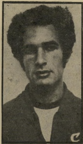
קובה: חואנטורנה יום חמישי, שעה 9.35

רי (8.55). התוכנית הראשונה של סידרה זו של