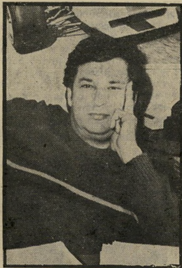
מנהל לבי-ארי איום התפטרות

בינתיים הודיעו עובדי הרדיו בירושלים לאלון, כי לא ישתפו עימו פעולה והציעו לו להתפטר מרצונו. עובדי החדשות בתל-אביב הודיעו כי הם מסרבים להכיר ב- פונקציה החדשה שנוצרה. עד שתגיע תשר בת אלון, השעה בינתיים לבי-ארי את התפטרותו. לבי-ארי נפגע בעיקר מכך ש- עוד לפני זמן קצר הסכים עימו לפיד שאין צורך בתפקיד של רכז כתבים. לא מן הנמנע כי למרות ההשעייה, יממש לבי-ארי, בכל זאת, את איום ההתפטרות שלו. מינויים אחרים בחדשות רדיו הם של יורם אפגור כמנהל היומן הבוקר הזה, של עמנואל הלפרין, בן אחותו של ראש-הממשלה מנחם בגין כמנהל בצהרי היום,