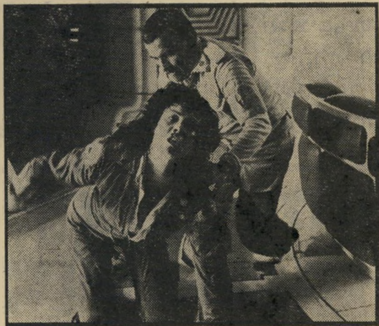
איאן הולי וסיגורני וויבר: לא רואים כלום

להתפעל מן התפאורה. אלא שהסרט כולו חשוך, אולי מפני שיוצרו הבחינות במלאכותיות ההפחות, והחלטינו להתבסס על הפחד של כל אדם מפני החושך. אשר למיפלצת, מידת יכולתה להפחיד תלויה במצב העצביים של כל אחד ואחד. דבר אחד אפשר להבטיח לכל: היא מגעילה מאין כמותה. אולי גם זה הישג.