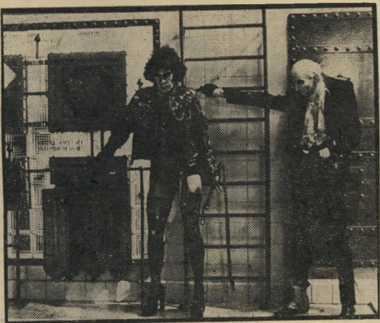
טים קארי וריצ'רד אבראיין: טעם של בדיחה

מו ברצינות, ואילו בוסטוויק וסאראנדון אינם צריכים להתיאמן כדי להיראות המומים מן המתרחש סביבם. הבדיחה ארוכה במקצת, חוזרת על עצמה ומשתמשת באמצעים פשטניים למדי, גם בעלילה וגם בביצוע הקול-נועי, ולכן מוטב לא לראות בה אלא בדיחה בלבד.