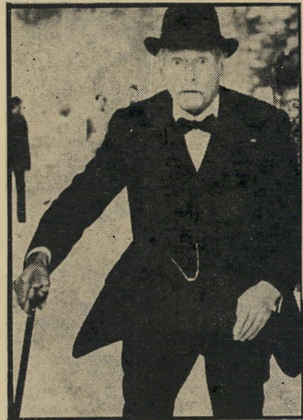
לורנס אוליבייה ב"נישור איה" — הציוריליציה של היבשת הזקנה

*** לאהוב מחדש (גת, צרפת) — אחרי מעקבו של הבמאי קלוד סוטה אחר גברים בגליהעמידה, בסרטו פול וינסן פרנסוא וכל האחרים, הוא מתבונן הפעם בנשים בגלים מקבילים — שנות הארבעים פלוס. דרך תיאור שלבי שיזה