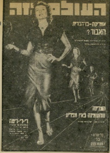
העולם הזה 890 תאריך: 4.11.54