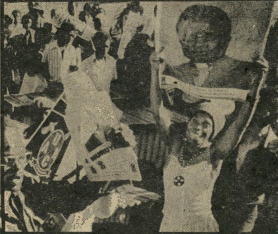
יחמוי מחתרת כורדים באיראן צרות בכל מקום

העולם כולו סובל מסירוף מערכות כללי בכל הנוגע לבעיות מיעוטים. האגודה הבריטית למגן זכויות מיעוטים פירסמה לאחרונה קטלוג חדש. הוא מהווה מיסמך מרשיע נגד הקהילה העולמית. בכל העולם רודי פים בני אדם בגלל צבע עורם, דתם או שפתם. גם ישראל נמצאת, כמובן, ברשימה הבלתי מכובדת הזו. כדאי שהקורא ידע משהו מהיקף הבעייה. בקטלוג המיעוטים הגרופים נכללים: ● סינים וקוראיים ביפאן. ● כושים בדרום-סודאן.