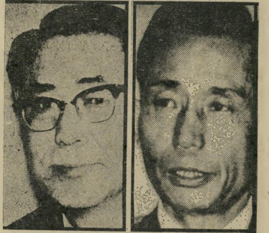
נרצח פארק ומחליפו קוין-הא שילטון הדיכוי יימשך

המשבר הקוריאני השפך את הצביעות העוטה את היוםרה הנוצרית של קארטר. בעיצומו של המשבר בקוריאה, כשאיינטלקטואלים וסטודנטים סיכנו את חייהם בהפגנות בערי הדרום פוסאן ומסאב, שיגר הנשיא לסיאול את שרי-ההגנה שלו. הרולד בראון לא הביא עמו את ספר התפילות הבאפטיסטי של קארטר, ולא הטיף מוסר. לעומת זאת הועיק קוריאה נושאות מטוסים עמוסות מטוסי F-15, והעמיד את 38 אלף חייליו במצב הכן. בראון הצהיר בפירוש, שאין לערוב את נושא זכויות האדם