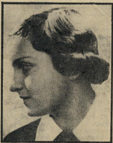
חנה סנש 7.11.44

12.11 — הסכם הפסקת האש נחתם רישמית בין ישראל למצרים בקילומטר ה-101.