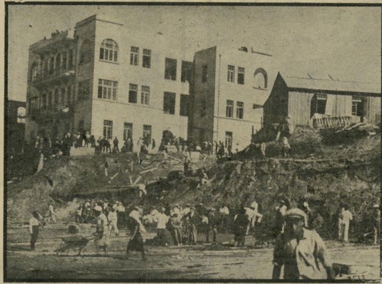
מרכז הכוח ה"סוציאליסטי": הבית האדום* הצבע דהה

בן-גוריון הוכיח שלמד היטב את לקח הפלמ"ח. בהבינו שחינוך ותנועות-נוער עשויים לעצב השקפת-עולם, מסוכנת, מיהר בן-גוריון לבטל את זרם העובדים בחינוך, והגביל את פעולתן של תנועות-הנוער הילוציות בבתי-הספר. בן-גוריון לא נגד לרעה בחינוך הדתי או הפרטי, תנועת הצופים הורשתה לפעול בבתי-הספר. בי בתי-הספר הללו גידלו את בני-בריתו. ● כיו שיוכל לפקח יפה על המתרחש בצבא, הקפיד בן-גוריון לשמור בידיו את תפקיד שר-הביטחון בכל פעם ששימש כראש-משלה.