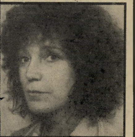
נושקה ואן בראקד אורחת בישראל

הולנד אינה מעצמת קולנוע. עושים שם כ-15 סרטים ארוכים בשנה, ועוד הרבה סרטים קצרים וסירטי אנימציה. מיגבלת השפה מעיקה על הקולנוע הזה כמו על כל קולנוע לאומי של ארץ קטנה, שאין מדברים בה את אחת השפות הבינלאומיות הנפוצות. תעשיית הסרטים נשענת במידה בלתי-מבוטלת על קרנות ועל הלוואות ממשלתיות המגיעות לעיתים עד 60 אחוז מתקציב הסרט. הלוואות ההופכות מענק ברגע שהסרט אינו מכסה את הוצאותיו, כל זה מזכיר מאד את הקולנוע הישראלי, אבל בכל זאת יש הבדל, ומי שרוצה להיווכח בו, מוזמן לבקר החל בשבוע הבא בשלושת הסינמטקים, תל-אביב חיפה, וירושלים, שם יוקרנו במשך חודש נובמבר סרטים הולנדיים.