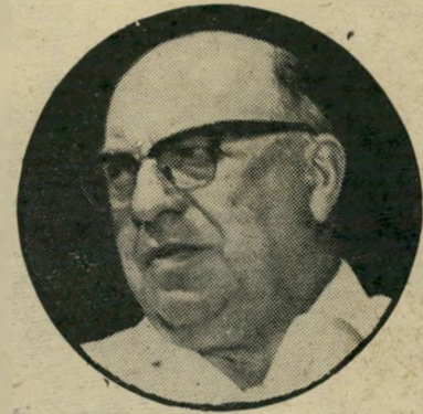
סרבן בורג "לא רוצה לעבוד..."

בסוף השבוע שעבר נראתה מלאכת ה" אירגון מחדש כמיבצע מורכב ומסובך של שבץ-נא. נדמה היה לרגע כי בגין יעוט על ההזדמנות של התפטרות שרי-החוץ כדי להחליף לפחות חמישה שרים בממשלתו, להכניס פנים חדשות לממשלה — מילבד