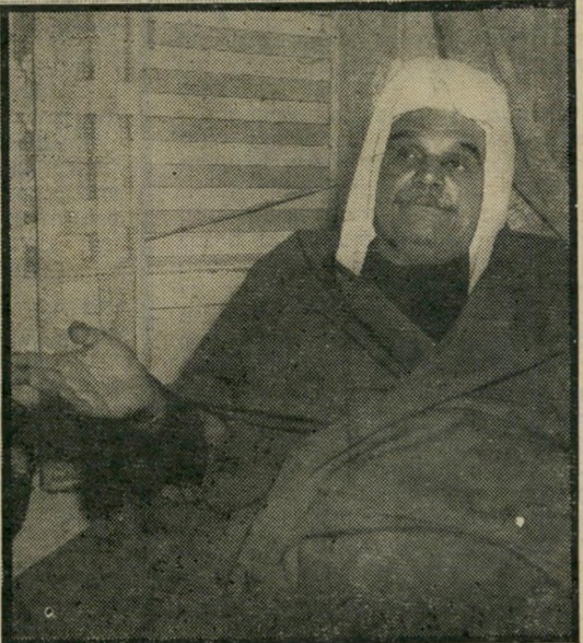
מגן-שר לשעבר השייך ג'בר מועדי מצפה לירוש