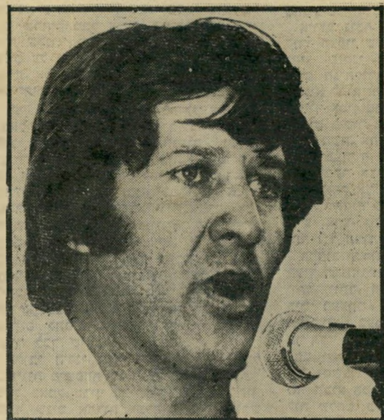
חבר כנסת זאידן עטשי מתקשר ומתכנן