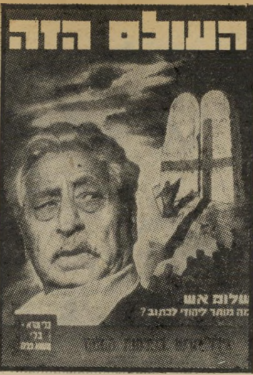
"העולם הזה" 889 תאריך: 27.10.54

המדור "במרחב" תואר ניסיון מרידה בלוב, נגד המלך אי- רים הראשון. המדור "מדע" סיקר את התפתחות המחקר המדעי במכון ויצמן. בשער הגיליון: הסופר שלום אש — מה מותר ליהודי לכתוב?