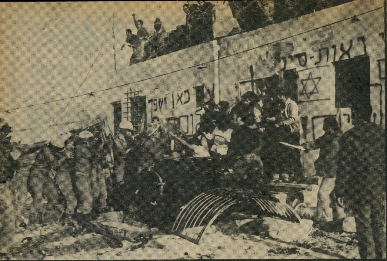
חיילים מסתערים על אנשי "גוש אמונים" בנג'ה-הירק של נאות-סיני מי הם "מפירי החוק?"

למנחם בגין הוא הצורך למלא את פסק הדין של בית-הדין העליון תוך עימות גלוי עם גוש אמונים. איומי אנשי הגוש, כי לא יקבלו על עצמם את פסק-הדין וכי יהיה צורך להוריד אותם בכוח מהתנחלותם, מפחידים את בגין הרבה מעבר ממה שבנת-מותרת רגיל יכול לשער.