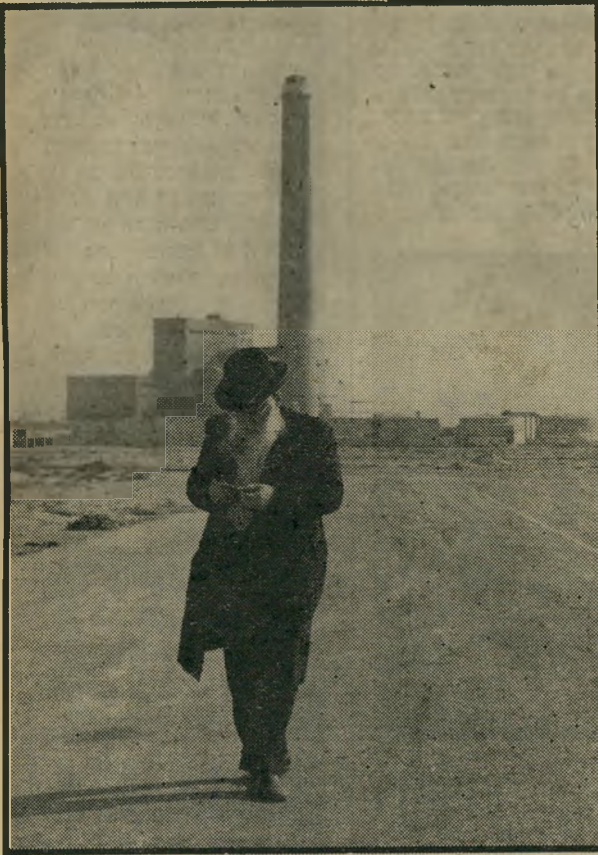
מנחם פרוש ח"כ אגודת ישראל ואיש העסקים הירושלמי הגיע לשרה-התעופה שדה-דוב בתל-אביב כדי לטוס לדרום הארץ. כיוון שהיתה זו שעת בוקר, החליט פרוש להתפלל עד שהמטוס ימריא, והוא עשה זאת באמצע מסלול ההמראה, כשברקע מזדקרת הארובה של רידינג.

שני האישים כשי, והסערה שככה. צעירי המפד"ל וביניהם שריה-הינוך זבולון הכהן ירדו ח"כ יהודה בן-מאיר, מעוניינים כי שריה-הינוך יוסף בורג, יקבל על עצמו את תיק החוק, בעיקר כדי לסלקו מהד מעוז החוק של משרד-הפנים. לכן לא היסס כלל בן-מאיר לשבח ולהלל את בורג בישיבת סיעת המפד"ל, שנערכה בכניסת שבוע שעבר. בורג הא-זין עד תום ואז פלט: „אתם רוצים שאני אהיה שריה-הינוך או שר החוצה?”