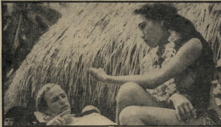
בראנדו וטאריטה — הפגישה ב"מרד על הבאונטי"