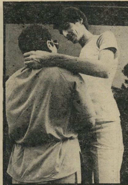
אסיר קריב עם מישהפתו הנאנסים לא מתלוננים

אני נמצא עם שבעה אנשים, חלק מהם התפרסמו בזמן האחרון בעיתונות, אבל אינני מעוניין לדבר עליהם, אולי הם אינם רוצים בכך. אני מסתדר איתם מצויין. יחסית לתנאים בכלא אנחנו חיים כמו מישהפה קטנה. בהרמוניה, בהבנה ובכבוד. לי אישית אין בעיות מיוחדות עם סוהרים או עם אסירים. עד היום אני יושב שנתיים וחצי בלי דו"ח ממשמעי אחד וזה הישג לא-מבוטל, כי בכלא על הפרת המישהפה הכי קטנה שופטים אותך. נרשמתי לאוניברסיטה הפתוחה ללימודי חשמלאי מוסמך. אני זקוק לזה כהשלמה למיקצוע שלי כמנהל אחזקה. אולי בקרוב יעבירו אותי למעשה, שהוא כלא הרבה יותר נוח. אבל כאן שום דבר לא בטוח. בינתיים בנו לי בכלא חדר מיוחד לאחזקת מכונות