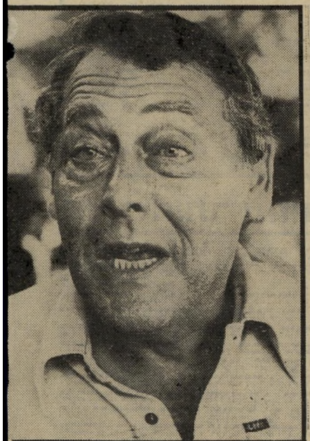
שימעון בר להשתדל שלא להרוג

● הסוציולוגית רות רזניק, מנ-הלת המיקלט לנשים מוכות בהרצליה: