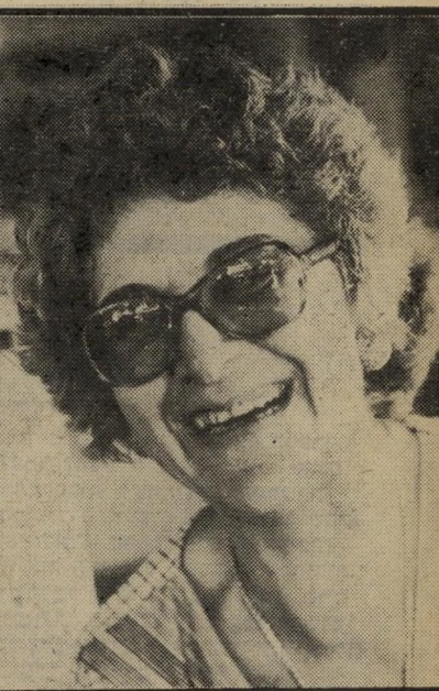
ברנה הרמנה להרוג את כולם