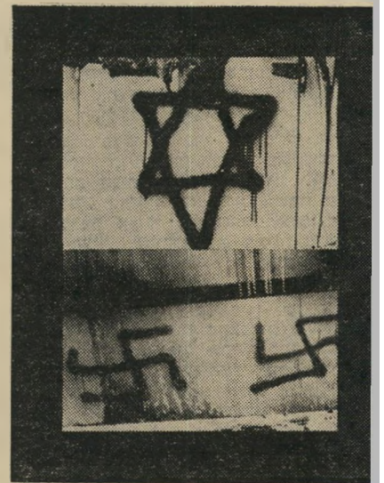
הציורים על החורבות — לא היתה כשרה

הוא ערך שיפוצים בבניין המהודר שרכש, הזמין אדריכל ידוע, כדי שיתכנן את המיבנה מחדש. בקומה הראשונה תוכננה מיסעדת־יוקרה אינטימית ל־45 איש. הקומה (החשך בעמוד 74)