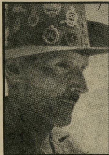
ברנרד לו מונטגומרי 23.10.1942

19.10 — הופעת בכורה של השחקן מרלון ברנדו בהצגה אני זוכר את אמא. 20.10 — הגנרל מק-ארטור נוחת ב- חוף המזרחי של האי לאיט. בפיליפינים, ומשמיע את אימרתו המפורסמת מאז: „חזרתי!“