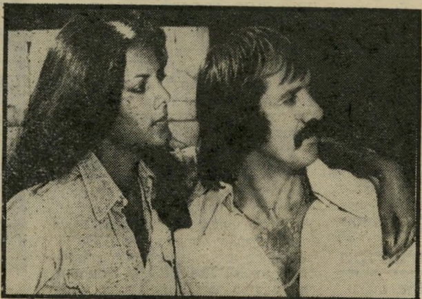
האיש השווה מיליונים : בוננו ובואלו יום ראשון, שעה 5.30