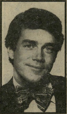
מיכללה למישפטנים יום שלישי, שעה 10.10

הכה את השטן (10.15). פארודיה על סירטי מתח עם המפרי בוגארט, ג'ני-פר ג'ונס, ג'ינה לולובריג'ידה, רוברט מורלי ופיטר לורה. כנופיית הרפתקנים המנסה ל-