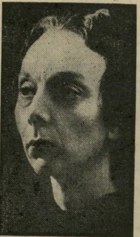
רבקה : מאמי יום שישי, שעה 9.20

ציוניים ואחרים מתוך כוונה. הם היו צריכים לגשר על הפי ער בין מדינה שנמצאה בפיס-גת הפריחה התרבותית העול-מית לבין התנאים הקשים ש-שררו אז בארץ. בעוד הייקים הסתכלו על התושבים כאן כעל פראים, הפכו הם עצמם בדיחה בעיני הישוב הוותיק. גוטמן, בן להורים יקים, ערך את הי סרט מנקודת-ראות אישית ל-גמרי. הסרט נפתח בתיאור סבתא המספרת לנכדתה את הנזל וגרטל בגרמנית. עד היום ישנם יקים שסרבו או לא הצ-ליחו ללמוד עברית. אחר-כך נערך באותו בית קונצרט של מוסיקה קאמרית והתרפקות על תמונות מהאלבום. שצולמו בי מולדת. אחד מגיבורי הסרט הוא הרופא הפרופסור מנט מרקוס, המתגורר בבית מוקף חומה שהוא העתק מדוייק של ביתו בחבל הריין. גיבור אחר של הסדרה הוא הי"ר ראובי הכט, יועצו של ראש-הממשל-לה ובעל ממגורות דגון, המנהל את עסקיו בצורה יקית טיפו-סית. אין זו הופעת בכורה של סרט זה. הוא הוקרן כבר בטל-