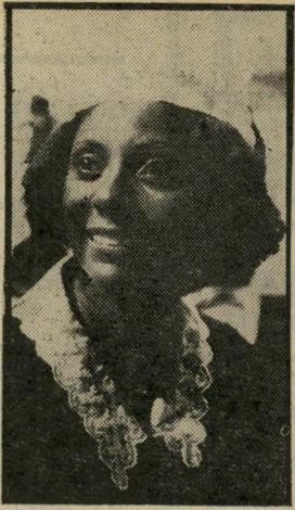
הבית הלבן : פארקס שבת, שעה 10.15

רבקה (9.20). פרק שלישי, האחד לפני האחרון של סדרה זו, על פי סיפרה של דפנה דה-מוריה. לקראת נשף העומד להערך במנדולי מציעה סוכנת הבית, שאותה מגלמת אנה מאסי, לאשתו של מקסים לבחור שימלה מגלרי-יית הבגדים שבבית. הנערה