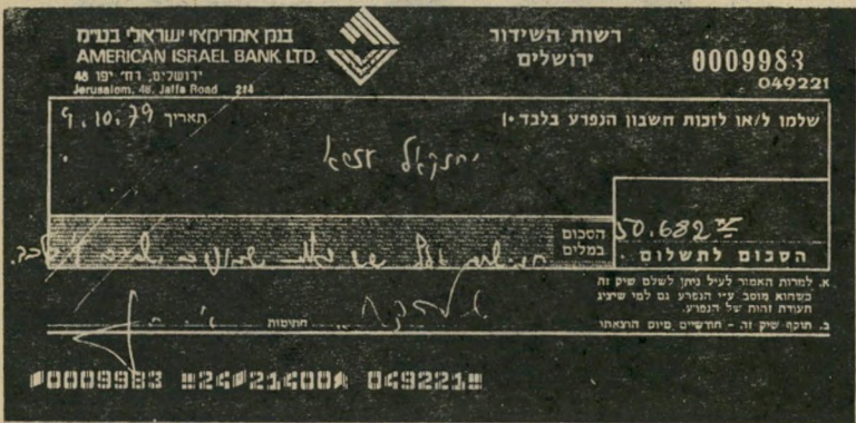
תצלום הצ'ק מרשות השידור — צדק בצורת צ'ק

אולם למרות זאת היתה צריכה לחלוף עוד שנה תמימה עד שיהזקאל קיבל את החצי השני של משכורתו. שניטל ממנו שלא כדון. נראה כי גם בגיבורות רשות השידור היים על ריווחי ריבית, אפילו אם זו באה בצורת הלנת כספים. רק בשבוע שעבר קיבל יחזקאל צ'ק על סך 50.682 לירות.