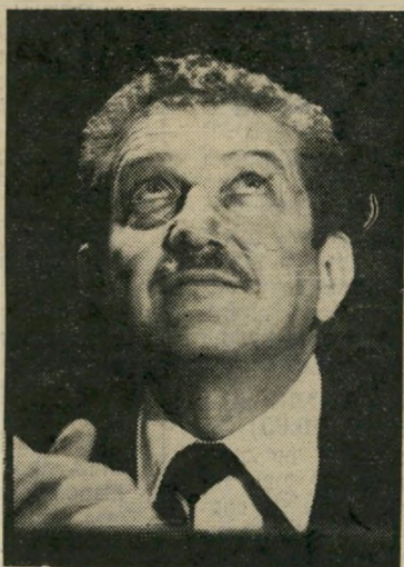
שר וייצמן קללות בלילה

אחרי קללות וייצמניות טיפוסיות, על כך שהעירו אותו באמצע הלילה, הופעלה שר-שרת הפיקוד הצבאית. וייצמן העיר את מזכירו הצבאי, אלוף-מישנה איתן רה"ר לדי. תהילה העיר את האלוף דיני מט.