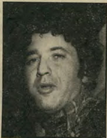
עזר וייצמן האיום לא פעל

נקבעה צפייה ליום ששי בשעה אחת כצהריים, שבה היה צריך המנכ"ל להחליט