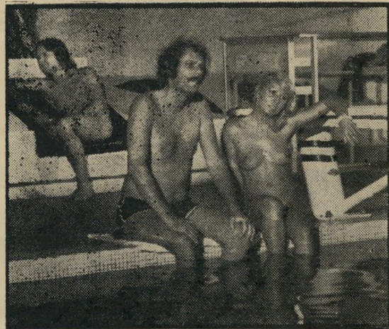
ז'אן לוק בידו: ניוון העולם המערבי

בין שלושת הזוגות הללו מתרוצצות דמויות נוספות, קורבנות של חייה-אהבה האומללים של התקופה, נערה שגילחה את ראשה מרוב אהבה, ואחת ששלחה את ידה, עם מכשיר חד, אל האבר של בן זוגה, נער ביישן העומד לפני נסיונו המיני הראשון, ועוד כיוצא באלה. כל אחד, מין סמל קטן ליד הסמלים הגדולים לשגיאות שאנו עושים