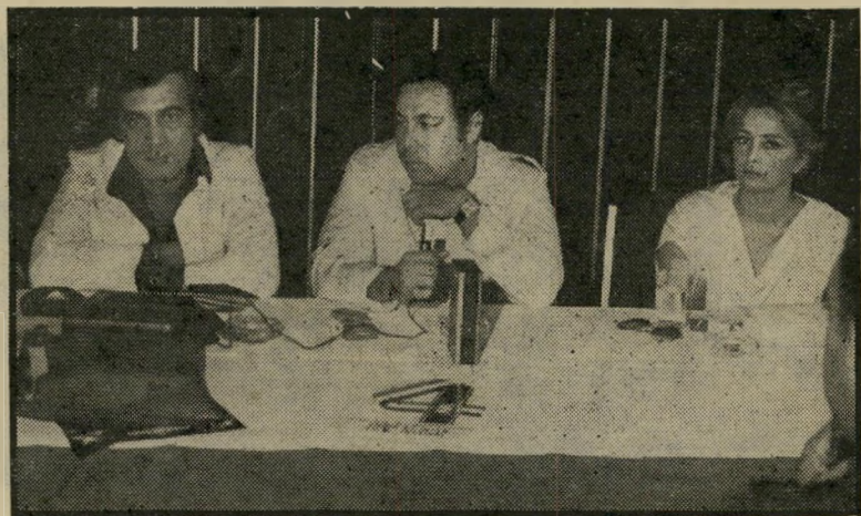
השחקנית נאגלה פתחי, הבמאי אשרף פהמי והשחקן מחמוד יאסין למען קולנוע מצרי ריווחי

שהרי לא יתכן שבארץ בת 41 מיליון תוש- בים יהיה מיספר בתי-קולנוע כימעט כמו בישראל. ראשית, עומדים לחוקק חוק, ש- לפיו כל בניין מיושרים גדול חדש יהוייב להכיל לפחות בית-קולנוע אחד. שנית, עומדים לשחרר ממכס את כל הרוכשים ציוד הקרנה לבתי-הקולנוע; וזהו עניין חיוני, בהתחשב בעובדה שכמעט כל בתי- הקולנוע המצריים לא הידשו את מער- כותיהם מזה שנות דור. ושלישית, מבטי- חים היום לבעלי בתי-הקולנוע החדשים,