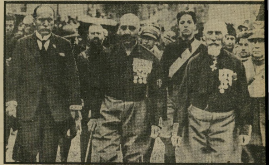
מוסוליני (משמאל) המיצעד עז רומא, אוקטובר 1922 קומדיה בחסות הצבא

לפני הציבור הישראלי, עמדה שאלה זו השבוע בכל חריפותה. האם מול ה־אספסוף המשולחב של גוש־אמונים עומד ציבור דמוקרטי, המוכן להגן על ערכי היסוד של חייו? האם נותר די כוח ב־שיכבה המדינית של ישראל כדי לבלום ולסלק איש כמו אריאל שרון? האם יהיה מי שיסלק בעוד מועד את הסוס הטרויאני