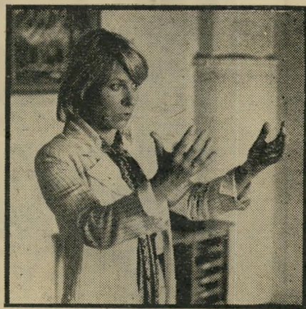
מרגרטה פון טרוטה במאית תסריטאית ושחקנית

כרבים מחבריו בגל החדש הגרמני, רגיש שלנדרוף במיוחד למעמד האשה בחברה, והדבר משתקף בסרטיו, לא מעט בשל שיתוף הפעולה ההדוק בין לבין רעייתו התסריטאית והשחקנית מרגרט פון טרוטה, שהפכה באחרונה גם במאית. לא רק היחס לקתרינה בלום, בסרט ש' בימוי יחדיו, מצביע על כך, אלא גם סרטים נוספים כמו אשה חופשית, המציג את סירוב החברה להתייחס אל אשה כיצור יצור שווה-ערך, או יריה של חסד, שבה שריקה אשה לשלם בחייה על ה' עובדה שאינה מתייחסת לאנשים במילי-