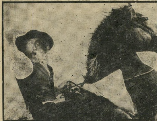
ג'ין וילדר: מוקיון מלבב

מקראה. אלא שוילדר מתקשה למצוא את הטון הנכון לתפקיד זה, ובכל פעם שהוא עובר מרצינות לצחוק ומצחוק לרצינות חורקים המהלכים בקולי קולות, ואילו לפורד חסר היום בדיוק מה שהיה חסר למקראה בצעיר-רותו — קמטי הפנים המעידים שאכן מדובר באיש מנוסה, שעבר את המערב בכל הכיוונים ואין עוד מי שיכול להפ' תיעו.