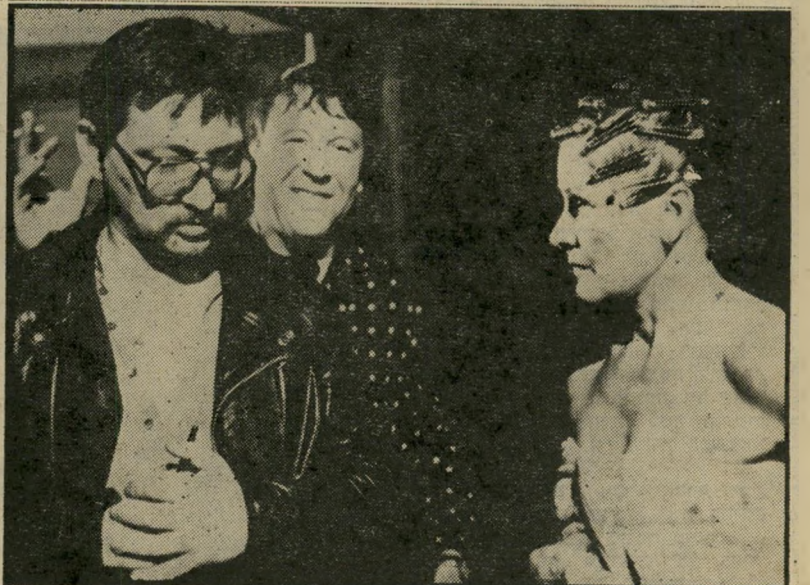
פאסבינדר מביים את "נישואיה של מריה בראון" מליחמה נגד עיוותים חברתיים

רתם לכל מקום בעולם, באמצעות מחד לקות התרבות של השגרירות הגרמנית או עליידי מכון גיטה. כך קרה גם בישראל. חודש אוקטובר בשלושת הסינמטקים יספק לישראל תמונה מהימנה של הקולנוע הגרמני, אם בשבועות קודמים של קולנוע גרמני, עשה הקהל הכרה עם סירטי פא-סבינדר, הנדרס והרצוג, שאפשר להתייחס אליהם כמעט כמו אל השילוש הקדוש של התעשייה הגרמנית הצעירה, תורחב היריעה הפעם לטובתו של פולקר שלני