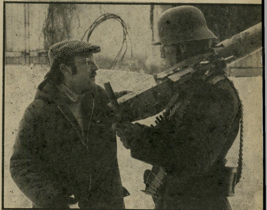
פודקר שלנדורף מביים את "יריה של חסד" הלם מליחמת העולם השנייה