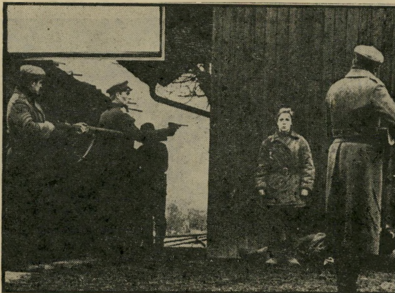
מעמד מתוך סירטם של שלנדורף ופון טרוטה, "ירייה של חסד" — ובעד מעמד צודק לאשה בחברה