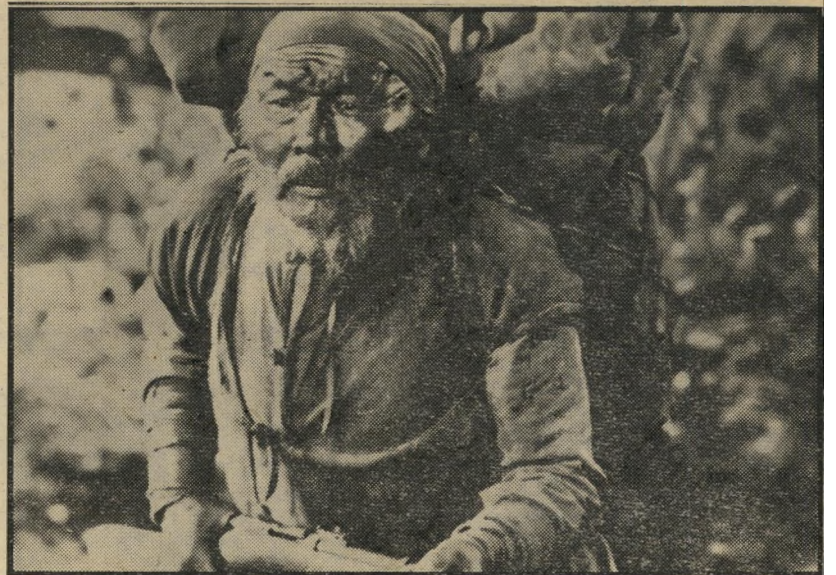
3. שומר היערות (יפאן — בריה"מ)