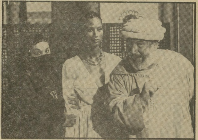
1. אשאנטי (שוויץ — ארה"ב)