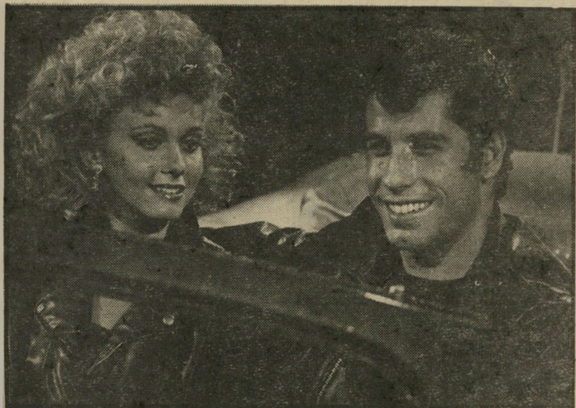
2. גריז (ארה"ב)