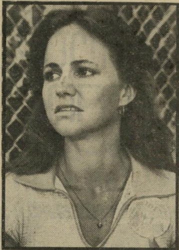
שחקנית השנה: סאלי פילד

צילומים, ולא הירפה עד הסוף. ואילו שאר תוצרת-הארץ, אין בה כדי לגרום נחת לאיש. אפשר, אמנם, לומר, שאופנה חדשה פשטה בארץ — תחת בורקאס וגעפילטע פיש הולכת וגדלה השיבותם של מיזמוטי בני-הנעורים. אלא שבני-נעורים, כמו שהם מתוארים בסרטים נוסח יוצאים קבוע או דיונון 99. הם מין יצורים החיים בעולם מלאכותי, מדברים בשפה פרטית משלהם, שנועדה להיות חברמנית אם כי היא מגויי חכת (גם בעיני בני-הנוער שהלכו לראות את יצירות המופת הללו), והעיקר: כל כושר המחשבה וההגיון של גיבורי שני הסרטים האלה מרוכז בין רגליהם. כל מה שמעסיק אותם הוא איך לשכב עם מי ולמה, וכל השאר שולי ומטופש. אבל אין צורך לדאוג. מקום הבורקאס לא נפקד כליל מן המסך, כל עוד "יצירות מופת" כמו אמי הגנרלית או שלאגר מוציאות בסביבה. אלה סרטים הממשיכים ב" מסורת הישנה של הקולנוע הישראלי, ו" מתייחסים לקהל שלהם כאל עדר של מפגרים, שאפשר לעוררו לתגובה רק על ידי בעיטה בישבן, מריטת-שיער או סנוקרת הגונה. כל אפקט מעודן מאלה הוא ב" בחינת חולשה של יפיינפש חולניים, ה" דורשים קורטוב של טעם מבלי להבין