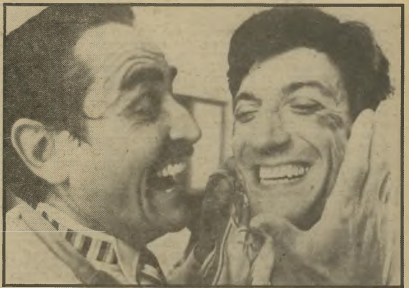
1. החתונה (ארה"ב)