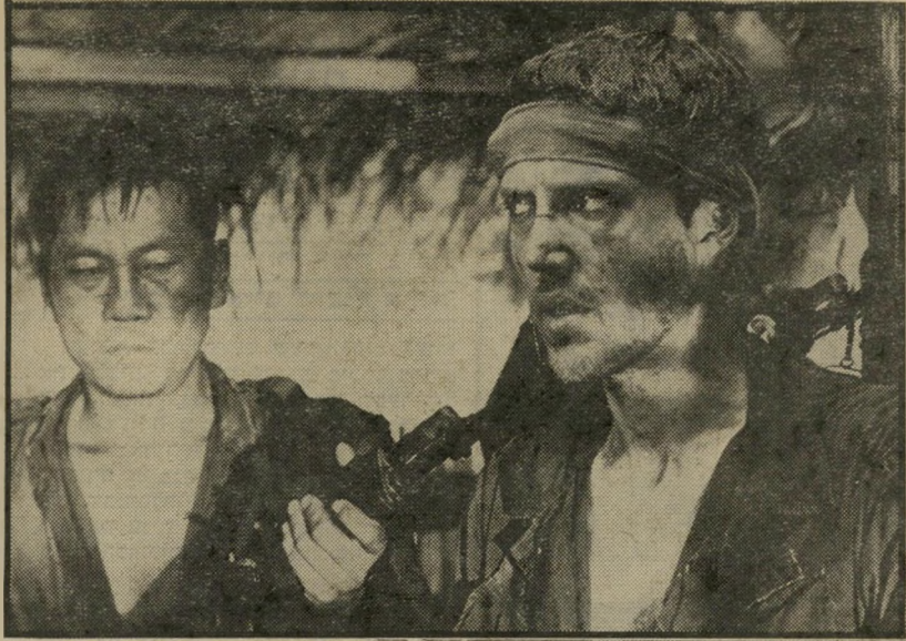
2. צנייד הצבאים (ארה"ב)