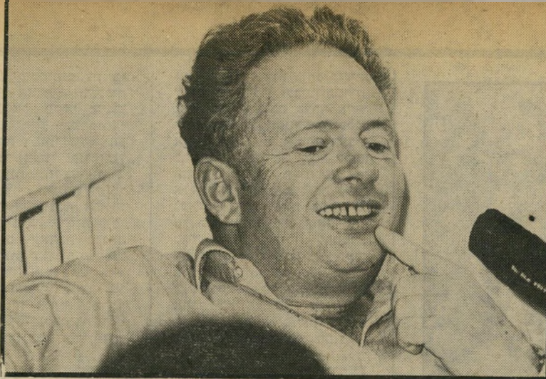
מנכ"ל לפיד ההרס נמשך