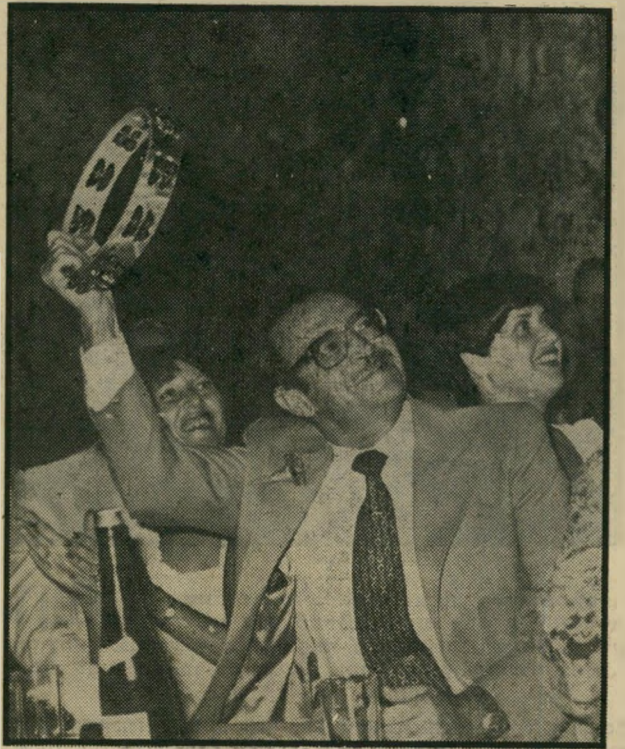
שימחה דיניץ מי שהיה שגריר ישראל בווינגטון מתגלה לחובבי הבילויים בירושלים כאיש כלבבם. אחרי שהומע בצילום עם שתי דוגמניות, נראה בשבוע שעבר דיניץ במועדון-לילה ירושלמי כשהוא לוקח חלק בשימחה הכללית. אחרי שקיבל מאחד מחברי התיזמורת כלי הקשה, ליווה במשך כל הערב את הרוקדים והוסיף למצב-הרוח.

■ חבר מפד"ל אחר, שר-הדתות אהרון אבו-חצירא מתנגד להתבטאות המפורסמת של שרהחוף על אריק שרון נגד סגן-ראש-הממשלה, הפרור-פסור ייגאל אלון, כשרון איים להפשיט את ידיו, "ערום וערייה על שולחן הממשלה". טוען אבו-חצירא כנגד שרון: