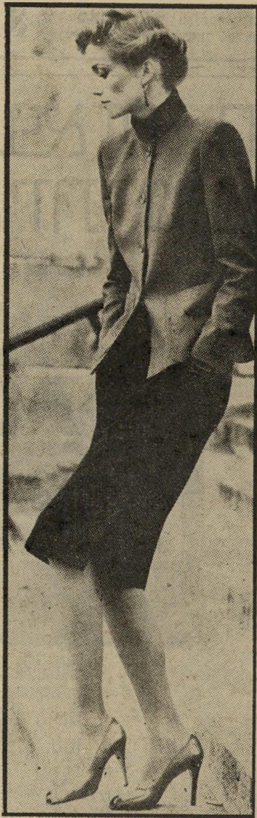
ז'קט קצר וצווארון גרו אפור עכבר