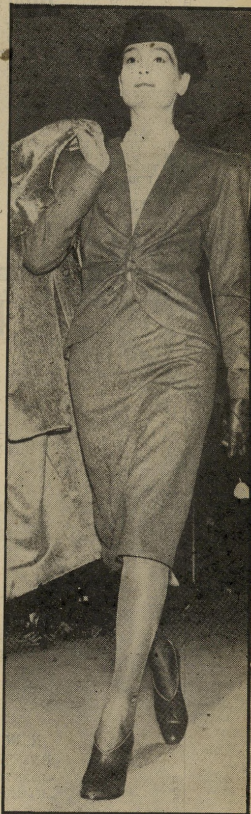
חליפת 2 חלקים אפורה הבד מפלנל רך