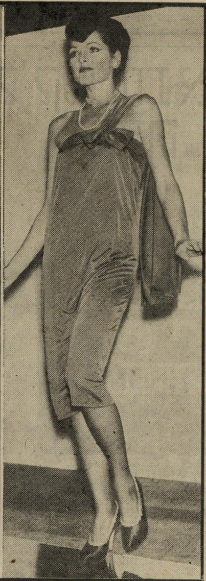
בדים שונים כצבעי האפור מהבוקר עד הלילה